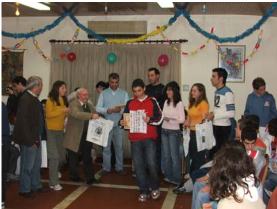
Entrega de recordações