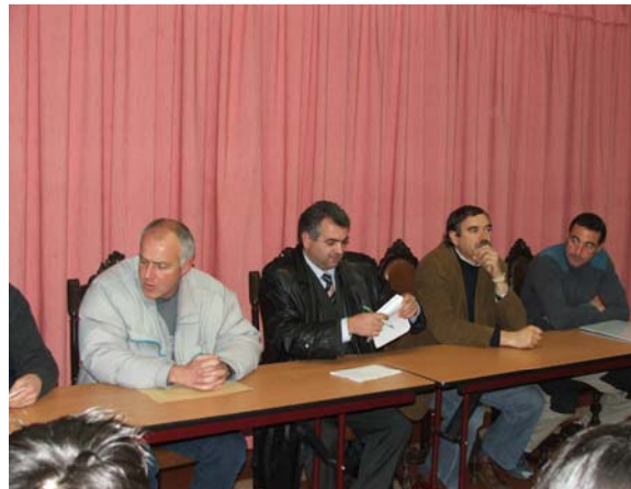
Conferência de imprensa