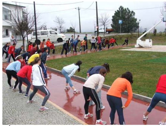
Último Treino (parque e Gimnodesportivo de Celorico)