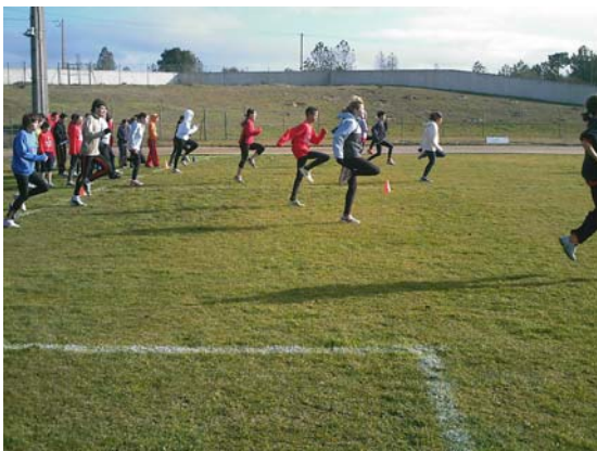
Treino de técnica de corrida (estádio Municipal de Celorico da Beira)