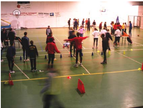
Treino de preparação física geral (Pavilhão Gimnodesportivo de Celorico)