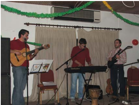
Música ao vivo