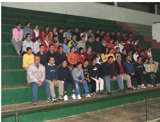
1ª foto de grupo