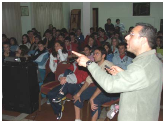
Visionamento do treino de técnica de corrida