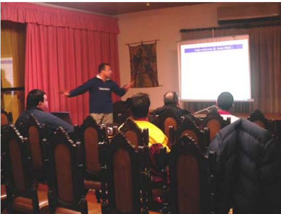
Uma das sessões de formação