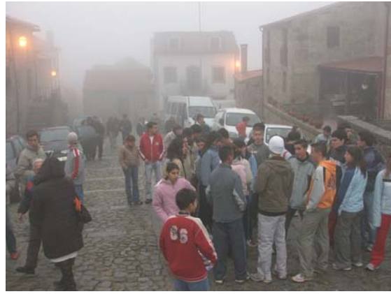
Visita a Linhares da Beira