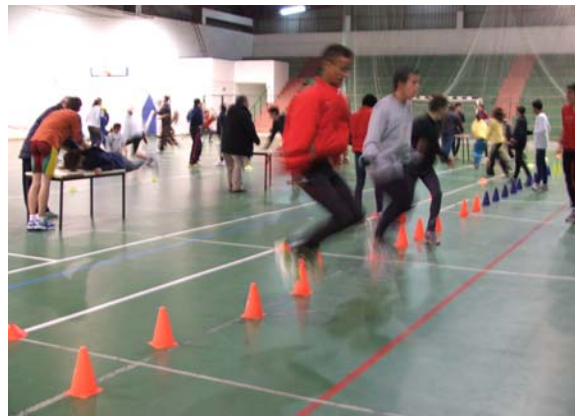
Treino de preparação física geral (Pavilhão Gimnodesportivo de Celorico)