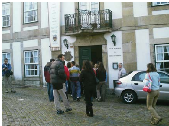
Solar do Queijo da Serra da Estrela (Celorico)