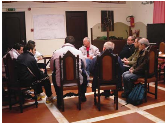
Reunião final de técnicos