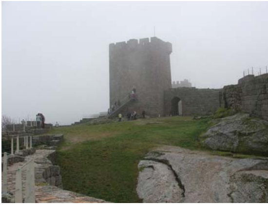
Visita a Linhares da Beira