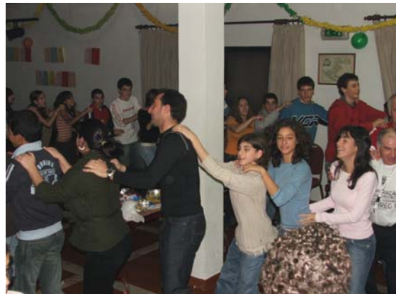
Festa de encerramento