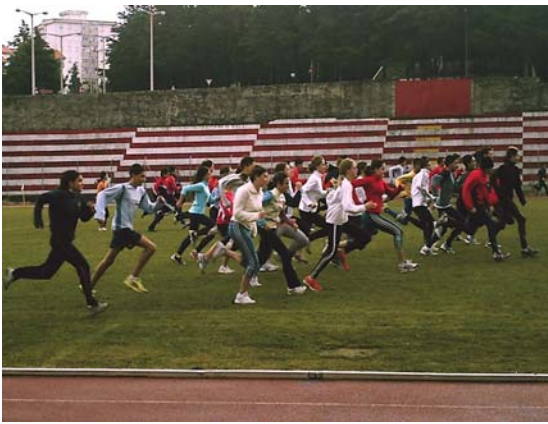
Treino (Estádio Municipal da Guarda)