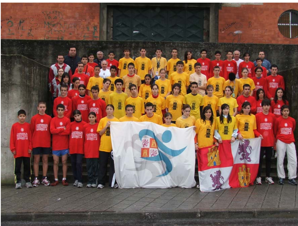
3ª foto de grupo