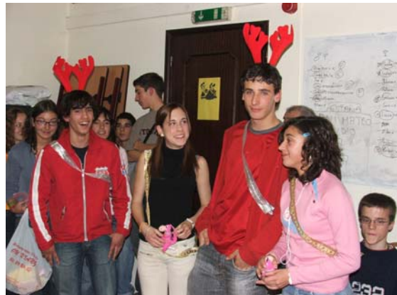
Eleição de Miss's e Mister's