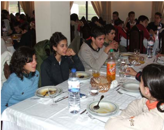
Almoço de recepção