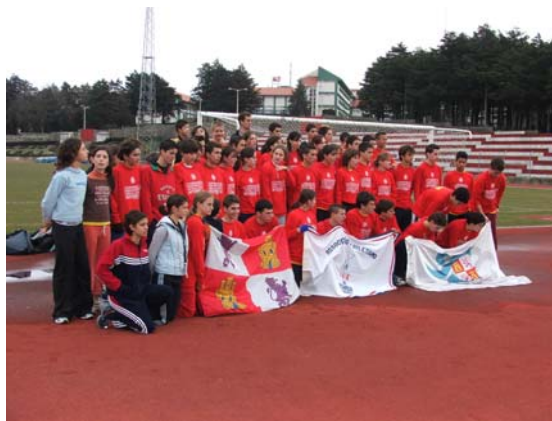
2ª foto de grupo