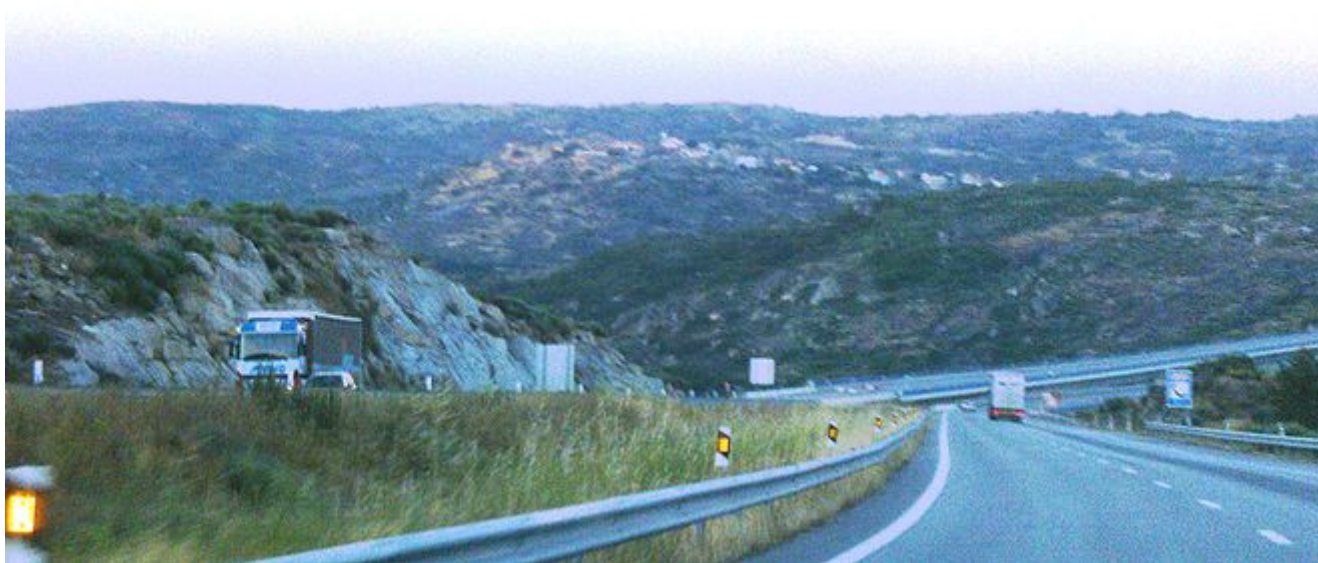
Castelo Bom visto da A25