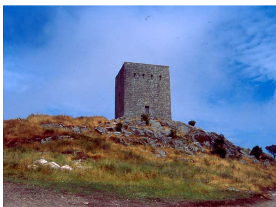
O ponto mais alto – 1 056m Torre de Menagem do Castelo - Guarda