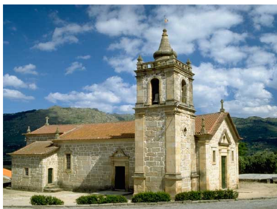
Partida junto à Igreja Matriz da Aldeia Viçosa (altitude: 525m)