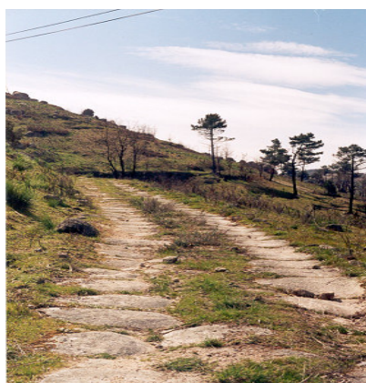
Um aspecto da Calçada Romana do Tintinolho